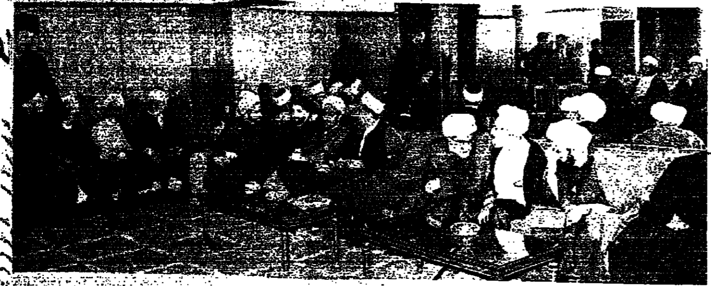
الإمام الصدر يتحدث إلى اصحاب الفصيلة العلماء

فتحت صباح اليوم الاثنين في فندق « بيروت انترناشيونال » ، حلقه دراسية حول تخطيط القوى البشرية والاستخدام في الدول العربية ، يشترك فيها عشرون بلداً عربياً ، ويمتد على عدة جلسات دولية وإقليمية عربية ، كما يشترك فيها أحد عشر مستشاراً دولياً متخصصاً في شؤون الاستخدام وتخطيط القوى البشرية والعامة .